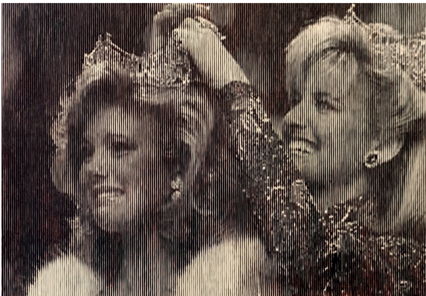
Susan Akin, Miss America 1986 (détail), 2024, gravure sur bois encré, 67 x 100 cm.

Le Quotidien de l'art : « Morgane Ely lauréate de la Villa Noailles Emerige »